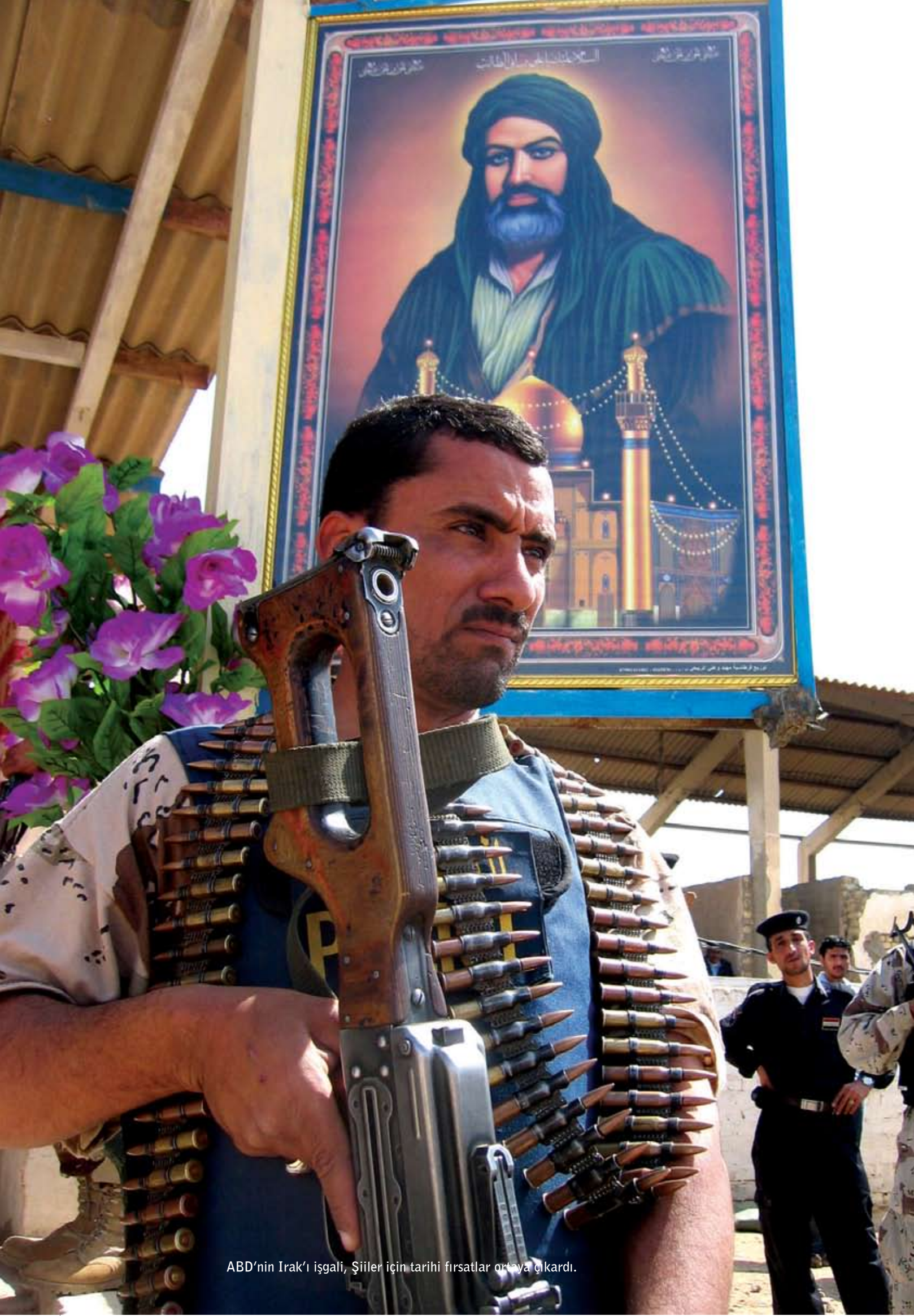
ABD'nin Irak'ı işgali, Şiiiler için tarihi fırsatlar ortaya çıkardı.