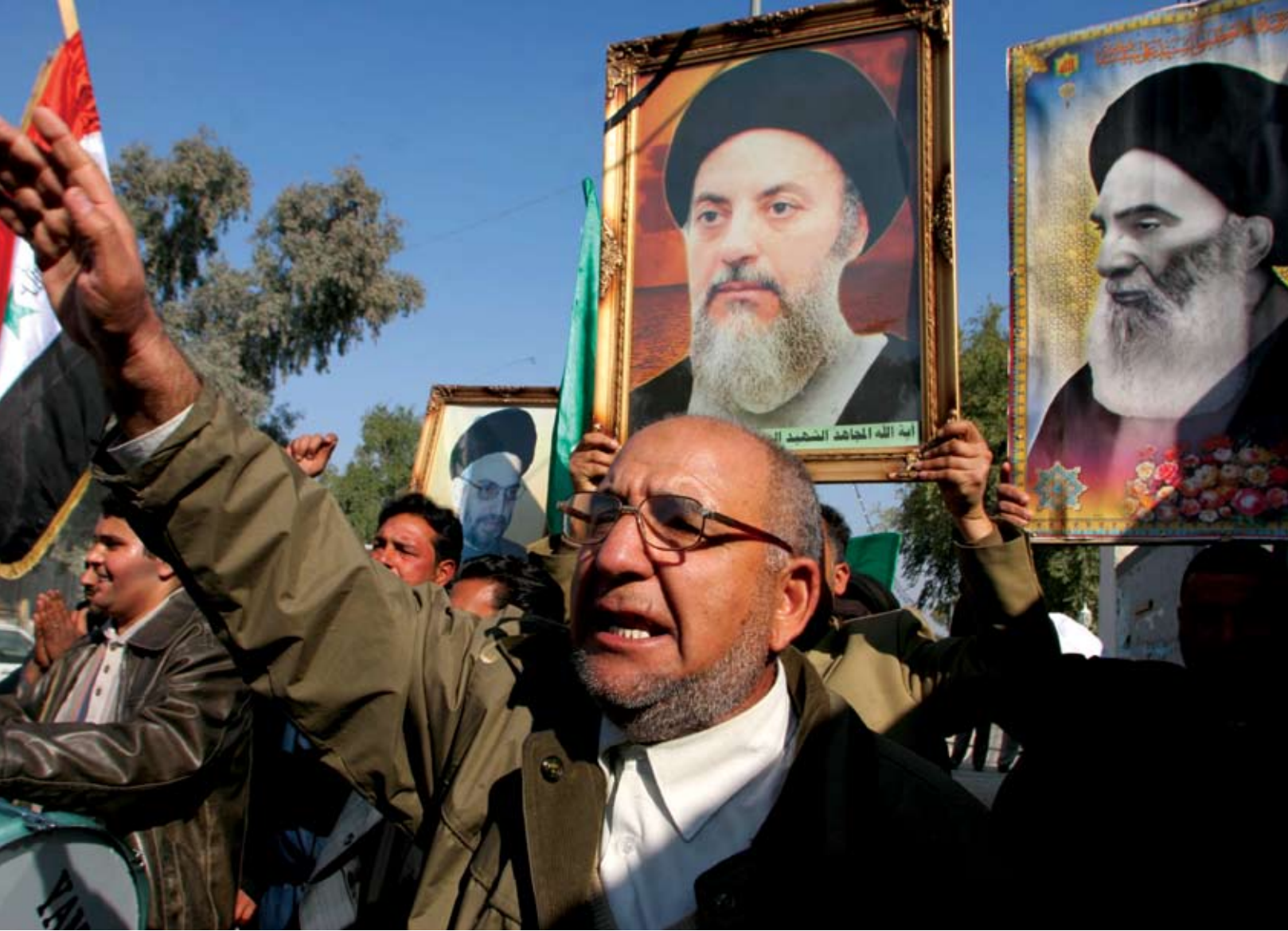
(Göstericilerin ortasında resmi tutulan) İslam Devrimi Şurası'nın eski lideri Muhammet Bakır el-Hakim, İran ve Irak'ı içine alan bir Şii imparatorluğu fikrini savunan az sayıdaki Şii entellektüelin ilkiydi.

leşik Irak İttifakı'ndan ayrı olarak katılmayı tercih etmiş olması, bir ölçüde bağımsızlık özlemi duyulduğunu herkese hatırlatmıştır. 4 Basra'daki yerel seçimlerde Dava Hareketi üç sandalye kazanmayı başarmıştır.