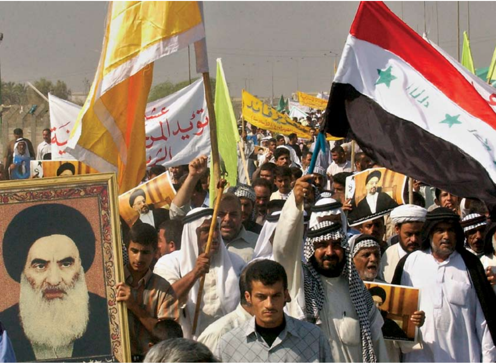
“Irak” kavramı yirminci yüzyıl başlarında Necef’te (ve bu arada Tikrit’te) ne kadar yaygın idiye, Basra’da da o kadar yaygındı.

bir rastlantı değildir.) 24 Hasan’ın aksine henüz ortodoks Şiilik ile aralarındaki köprüleri atmamış olan Sadr ve Hasani, geleneksel dinî düzenin mensuplarına özgü terminolojiyi kullanmaya devam etmektedir. Ancak Sadr ve Hasani’nin taraftarları açıkça Mehdi inancıyla flört etmektedir (ve bunu yapmalarına izin verilmektedir); bu yüzden Ahmet el-Hasan bu yolda onlardan çok daha fazla ilerlemiş bir Şii olarak önem kazanmaktadır. Ayrıca Ocak 2007 sonlarında Necef’te isyancılarla hükümet kuvvetleri arasında çıkan kanlı çatışmalar Hasan’ın günümüz Irak’ındaki genel Mehdilik akımı içerisinde bir lider olarak ne denli önem kazanmış olduğunu birden açığa çıkarmıştır. 25 Aşırı milliyetçi Hasan, toprak