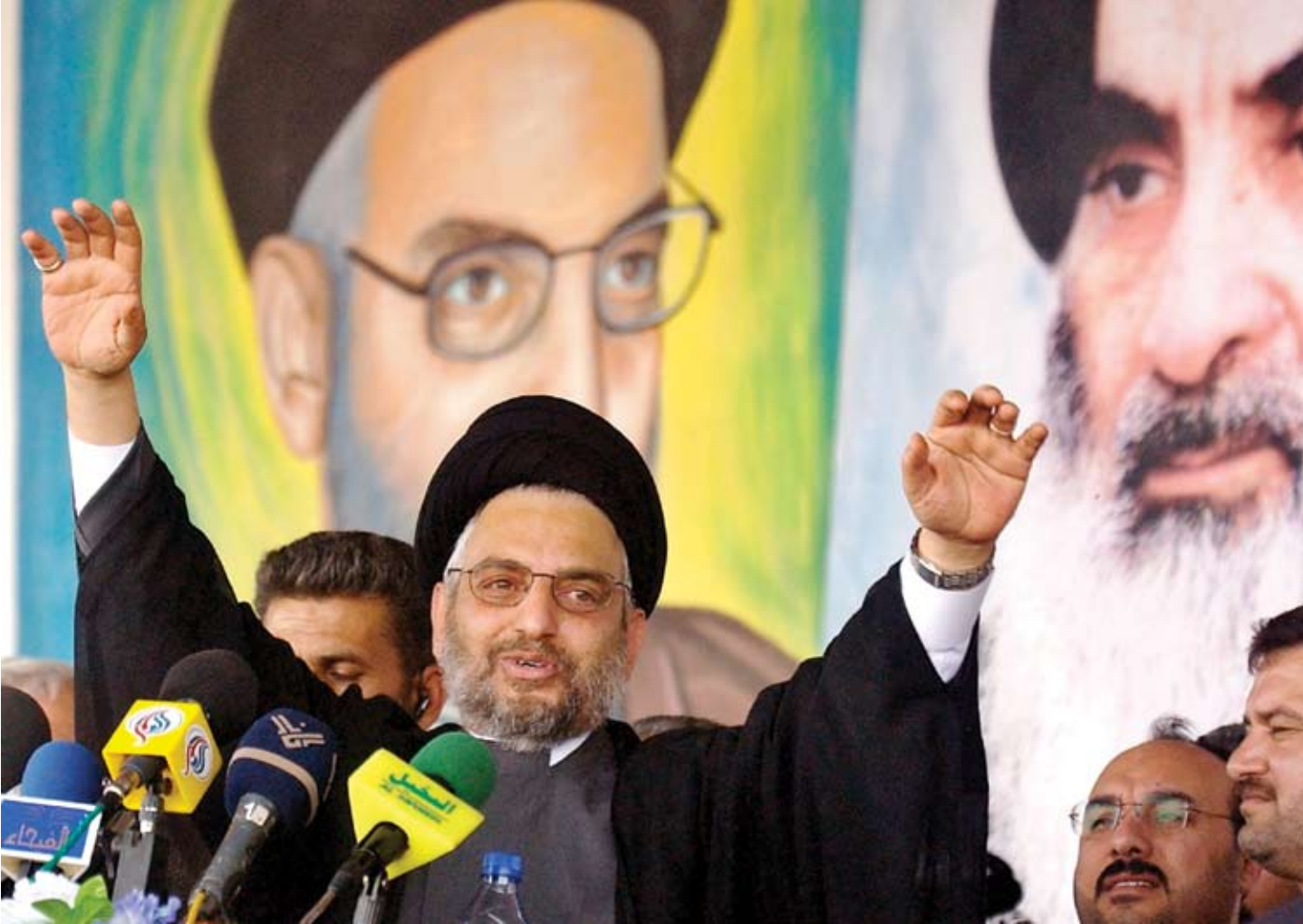
El Hakim'in başkanlığındaki Irak İslami Devrim Konseyi, geleneksel olarak İran'a yakınlığıyla biliniyor ve Şii Federe Devleti projesini savunuyor.

bölgelerinde yaşayanlar Irak'taki yeni milliyetçilik ruhunu ve üniter devlet modelini kolayca benimsediler. 1930'larda Basra'da petrol arama çalışmaları başladığında Irak'ta güçlü bir üniter devlet geleneği bulunmaktaydı ve petrol genelde -özellikle ister Şii ister Sünni olsunlar Arapların yaşadığı bölgelerde- ulusun tümüne ait bir kaynak olarak sayılmaktaydı. Zaman zaman Kerkük petrolünün "Kürtlerin" olduğu iddia edilse de, Basra petrolü konusunda Araplarca buna koşut herhangi bir sahiplenme iddiasında bulunulmuyor, hem rejim hem de muhalefet yanlıları Basra petrolünden her zaman ortak ulusal bir değer olarak söz ediyordu. 3